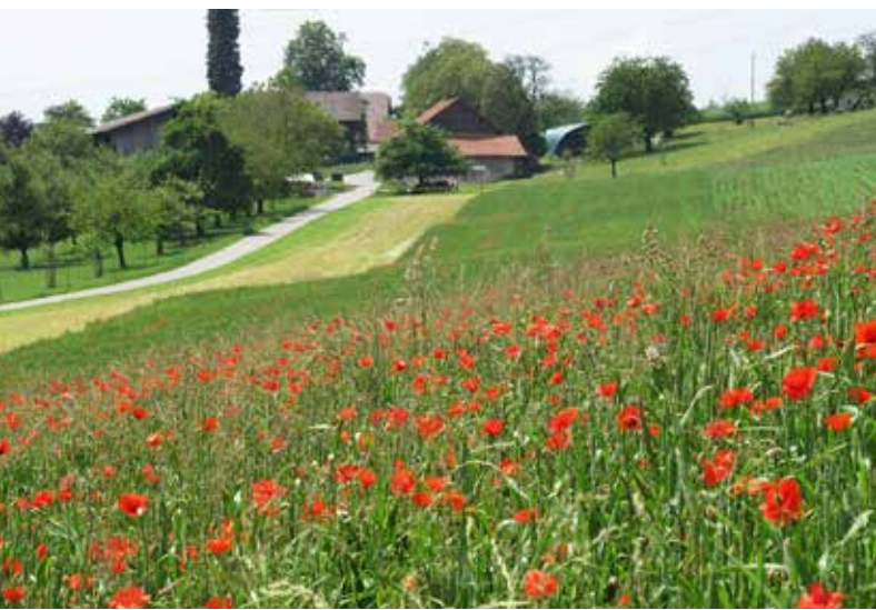
Abb. 1 | Bei einer Umstellung auf Biolandbau würden mindestens 50% der heute verwendeten Menge an Pflanzenschutzmitteln eingespart.

Auskünfte: Lucius Tamm, E-Mail: lucius.tamm@fibl.org