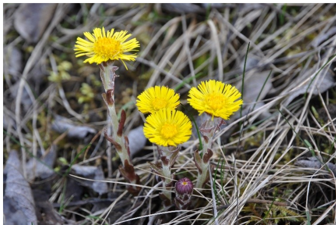
Abbildung 1: Im frühen Frühjahr blüht der Huflattich charakteristisch gelb. Die Blätter erscheinen erst nach der Blüte.

Die Pflanze ist zur Blütezeit 10–15 cm, später bis 30 cm hoch 3 . Die eigentlichen Blätter treiben erst nach der Blüte aus und sind zuerst beidseitig graufilzig, behaart. Später «verkahlt» die Blattoberseite 3 . Die Blätter sind herzförmig, langgestielt und die Blattspitze kann bis über 20 cm lang werden. 3